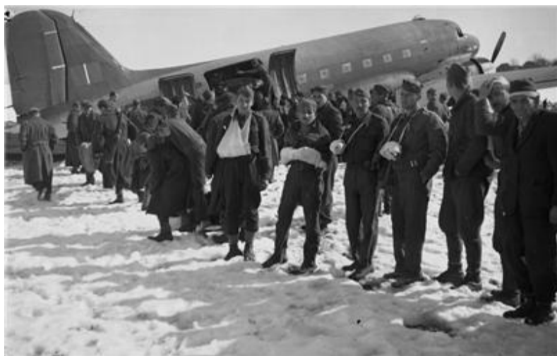
Čakanje na rešilni polet