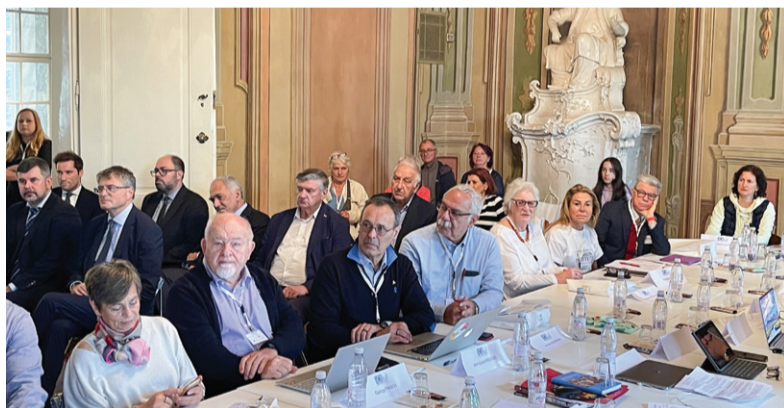
Delovni sestanek je bil v prostorih Muzeja novejšje in sodobne zgodovine Slovenije.