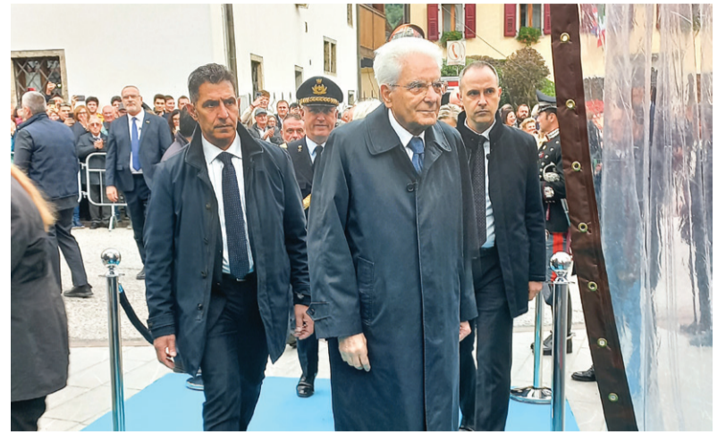
Slovesnosti se je udeležil tudi italijanski predsednik