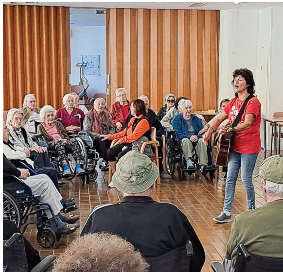
Počastitev praznika priključitve Primorske v Izoli