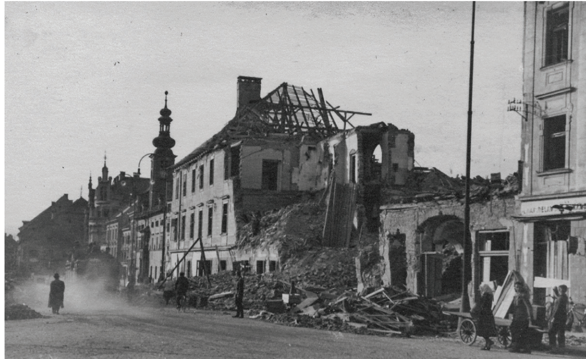
Med zavezniškim bombnim napadom na Maribor 14. oktobra 1944 so bile porušene tudi stavbe na Glavnem trgu.

Po številu žrtev je bil največji napad 14. oktobra 1944, zahteval je 76 človeških življenj in 152 ranjenih. Sledil mu je napad 1. marca 1945 s 75 žrtvami (za ta napad ni podatka o številu ranjenih), med prvimi bombardiranjema Maribora januarja 1944 je umrlo 55 ljudi, 52 je bilo ranjenih, 6. decembra 1944 52 mrtvih in 30 ranjenih, 1. aprila 1945 pa 32 mrtvih in 15 ranjenih. Samo v petih največjih bombnih napadih je izgubilo življenje 290 ljudi ali 60,04 odstotka žrtev. V desetih bombnih napadih je bilo od