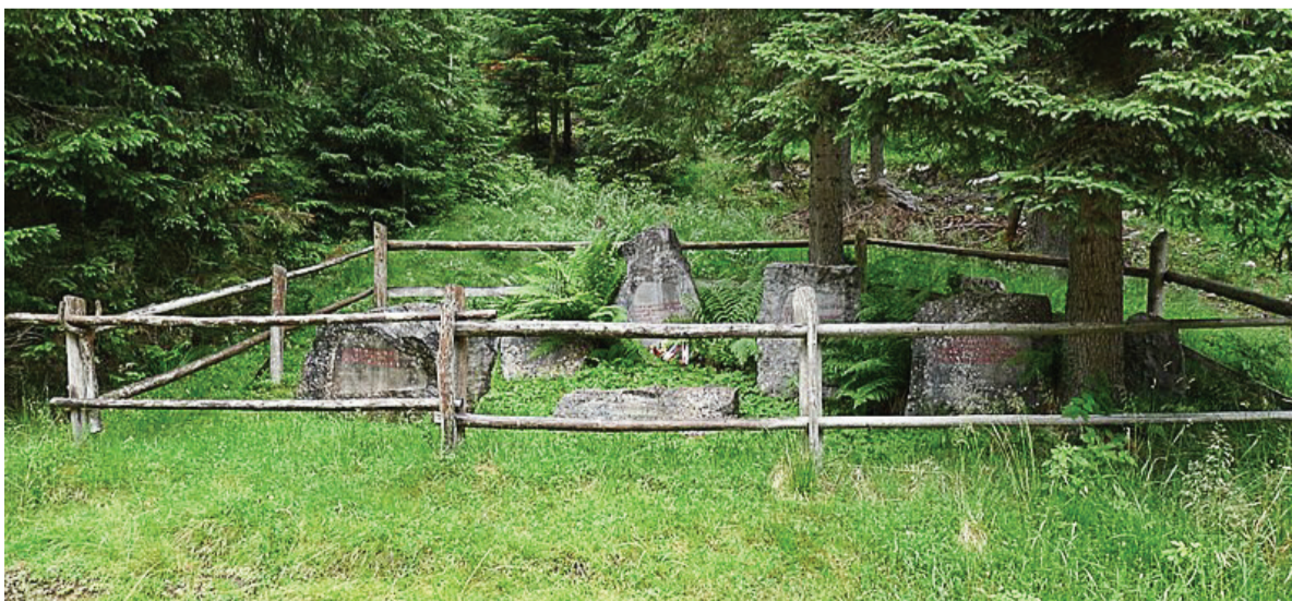
Spomenik na Lipniški planini