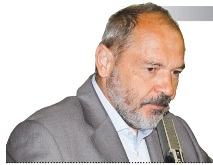
Dr. France Križanič