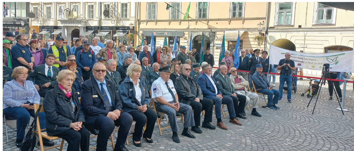
Zaključna slovesnost je bila pred mestno hišo

policijskih veteranskih društev Sever in Zveza društev in klubov MORiS – so se tudi letos tradicionalno odzvale in pripravile Pohod za mir. Udeleženci so se zbrali pred Moderno galerijo in se po ljubljanskih ulicah sprehodili do Magistrata, kjer je potekala osrednja slovesnost. V sprevod so sprejeli tudi člane društva Spominčica – Alzheimer Slovenija, ki so na platuju pred Narodno galerijo zaznamovali dan boja proti tej bolezni. Pred mestno hišo je zbra-