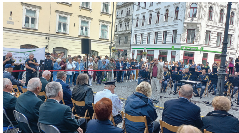
Koncertu so prisluhnili številni turisti