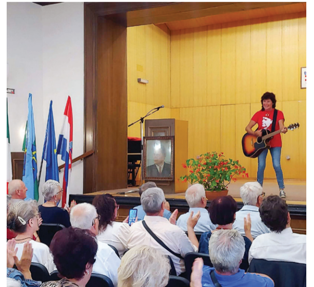
Prireditve v Grožnjanu