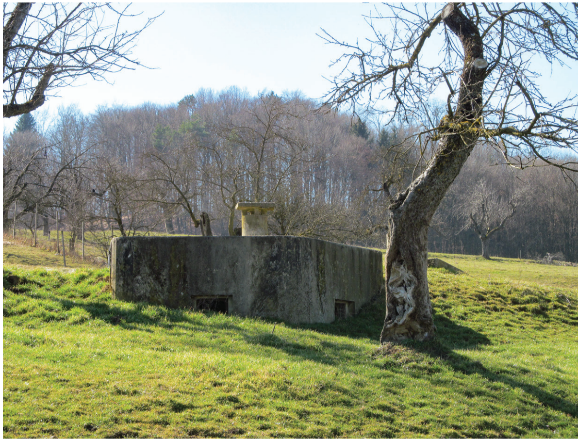
Eden od bunkerjev Rupnikove linije ob Pesnici

odseka Rupnikove linije med Črno na Koroškem in Markovci pri Ptuj. Ob nemškem napadu na Poljsko 1. septembra 1939 je gradnjo prevzela vojska. Ta je vpoklicala veliko število rezervistov, ki jih je nato uporabila kot gradbene delavce.