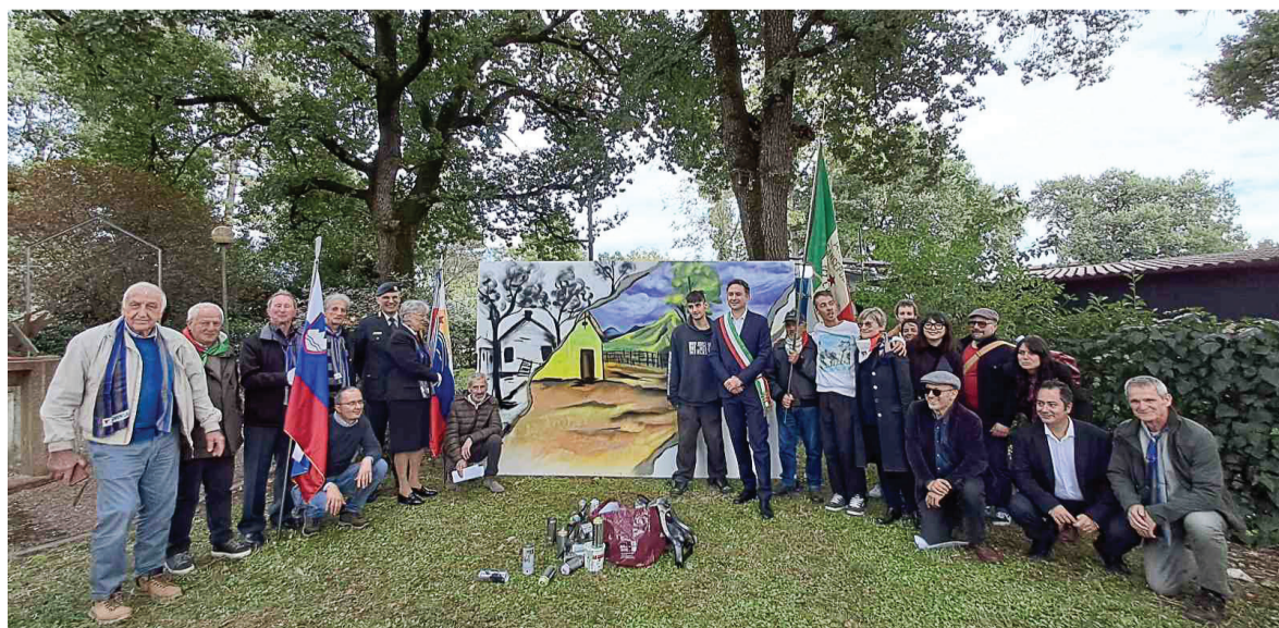
Gostje in ustvarjalci kulturnega programa v nekdanjem koncentracijskem taborišču Renicci.