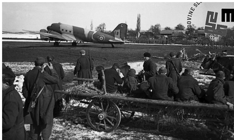
Počitek po naporni poti

je bilo na zdravstvenih delavcih in petih brigadah 31. in 30. divizije, ki so nosile in delno vozile ter vojaško varovale ranjene tovariše, saj je transport med drugim močno ogrožalo tudi deset sovražnikovih postojank v bližini nameravane poti. Tri brigade 31. divizije pod poveljstvom Staneta Potočarja - Lazarja so 13. avgusta najprej prevzele 30 ranjencev iz bolnice Franja pri Cerknem. Vozovi in tovornjaki so jih odpeljali do Želina in od tam se je začelo zanje in za borce nosače veliko trpljenje, naporen vzpon v Jagršču, prek Šebreljske planote, strmin Krnice, Oblakovega Vrha in Rzelja do Vojskega. Na tem 14-urnem napornem pohodu so omagovali ljudje in živina. Zvečer 14.