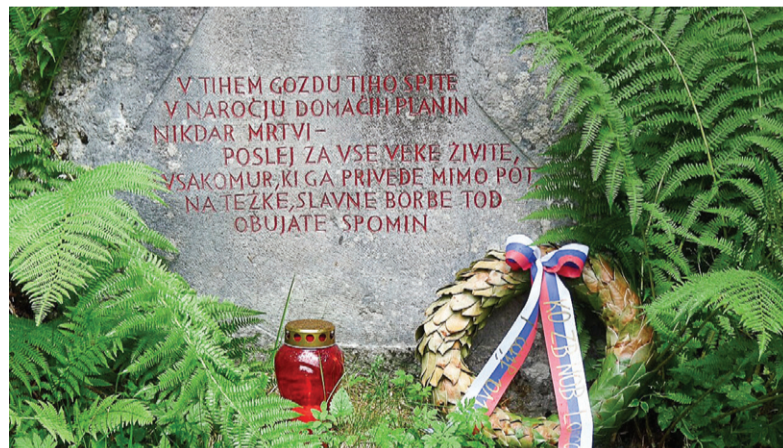
Spomenik na Lipniški planini