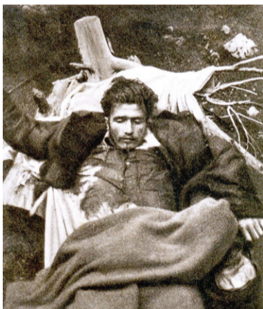
Mrtev partizan na Lipniški planini

Mimogrede, dolgoročne finančne obveznosti Termoelektrarne Šoštanj so konec leta 2023 znašale še 276 milijonov evrov.