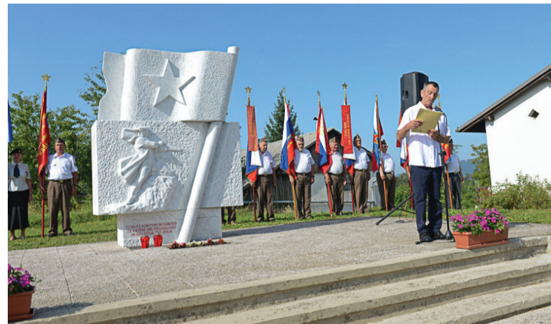
Odkrijte spomenika v Planini

govornik na proslavi, je poudaril pomen generala Rudolfa Maistra, ki je po koncu prve svetovne vojne s svojim pogumnim dejanjem severovzhodni Slovenije priključil Kraljevini Jugoslaviji. Druga svetovna vojna je našemu narodu zadala krvave rane – tudi zaradi kolaboracije, ki je bila prisotna na slovenskem ozemlju, po nekaterih krajih pa je bila zelo močna. Govornik je poudaril, da nas je narodnoosvobodilni boj postavil na pravo stran zgodovine in nam dal pravico, da proslavljamo skupaj z narodi, ki so se borili za osvoboditev Evrope izpod fašističnega in nacističnega jarma. »Slovenski partizani in partizanke so si izbojevali marsikatero bitko in dali mnogo žrtev na oltar domovine, da danes uživamo svobodo. Brez narodnoosvobodilnega boja bi nas osvobodila Sovjetska zveza in bi prešli v vzhodni blok,« je dodal Šarec.