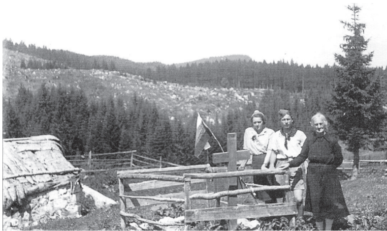
Grob partizanov na Mošenjski planini leta 1946

Med jeloviškimi obeležji imata posebno mesto spomenika na Mošenjski in Lipniški planini, ki spominjata na dve bitki Cankarjevega bataljona leta 1942, obe sta se končali s številnimi partizanskimi žrtvami. Revizionistični »domoljubni« zgodovinarji žrtve spopada na Mošenjski planini 13. januarja prištevajo kar k dražgoški bitki nekaj dni prej, da bi izenačili padle na slovenski in nemški strani in tako zmanjšali njen pomen ter jo prikazali kot partizanski poraz.