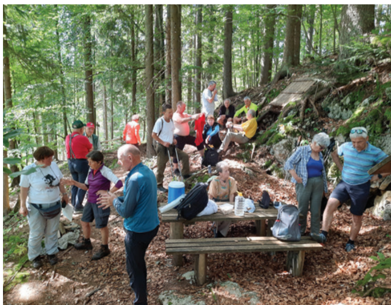
Deseti pohod k tehniki Meta