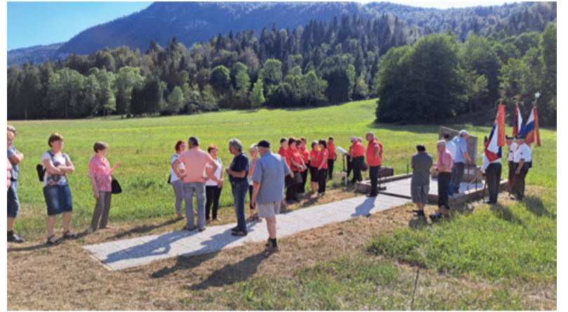
Udeleženci spominke slovesnosti v Plešcih