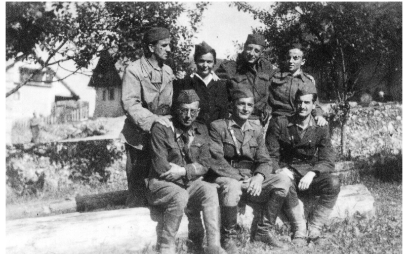
Zdravniki predavatelji v Višji sanitetni šoli

Edinstvena je bila slovenska partizanska saniteta, edinstvena v požaru, ki je gorel po Evropi. Zavezniki po vojni, pa tudi tisti, po večini britanski, opazovalci, člani zavezniških misij ki so se zdrževali med partizani, so lahko le nemo opazovali vrhunsko organiziranost naše sanitete. Sovražnik se je loteval vsega, da bi jo ohromil ali jo uničil. Zakaj? Z njenim uničenjem bi omajal in nazadnje uničil bojno moralo partizanskih sil. Da bi to dosegel, se ni obotavljal uporabljati zverinskih, sadističnih metod. Boj z njim je spreminjal svoj obraz, na slehernem koraku pa je terjal silno čuječnost, premetenost, drznost in osebno junaštvo. Samo z globoko in predano vero v zmago partizanske vojske je bilo mogoče razviti te lastnosti in kreposti, ki so kljubovale krutim sovražnikovim silam in nakanam. Partizanska medicina je herojska in pomeni epopejo v zgo-