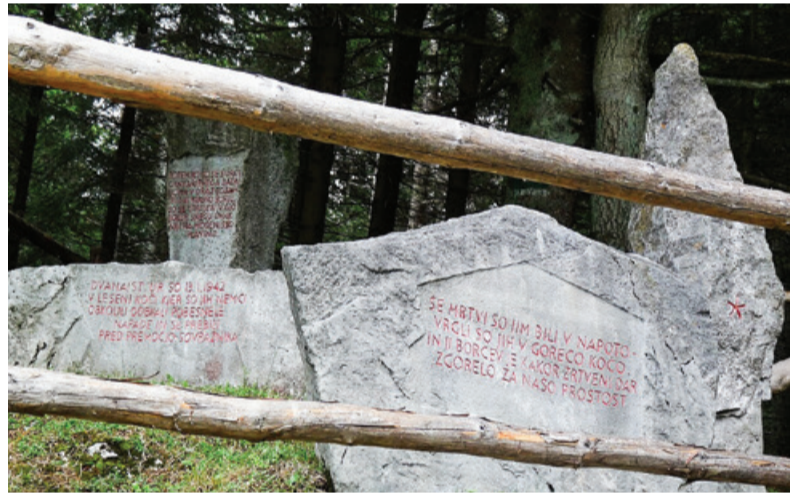
Spomenik na Mošenjski planini

Po bitki v Dražgošah sta se 12. januarja 1942 dva voda Cankarjevega bataljona, Bičkov in Pečnikov, skupaj okoli 40 borcev, z ženskami in otroki 60 ljudi umaknila v kočjo na Mošenjski planini na Jelovici. Izbira zatočišča strateško ni bila najboljša, saj je kočja stala na čis-