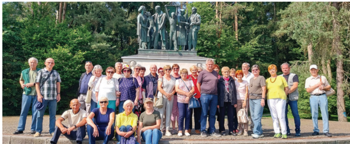
Udeleženci strokovne ekskurzije