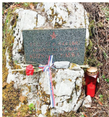
Spominsko obeležje umorjenemu partizanskemu kurirju