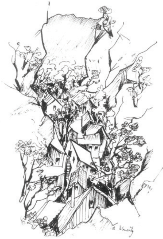
Bolnica Franja