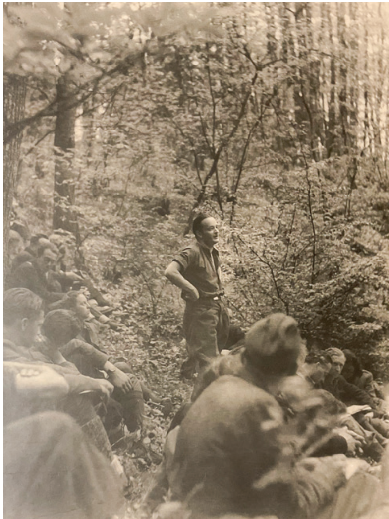
Boris Kidrič med vojno

Seveda imam veliko spominov nanj, eden od njih je povezan z očetovo navado, da je tudi doma globoko razmišljal o problemih, ki jih je skušal razvozlati. Slika naše dnevne sobe, v kateri oče hodi sem