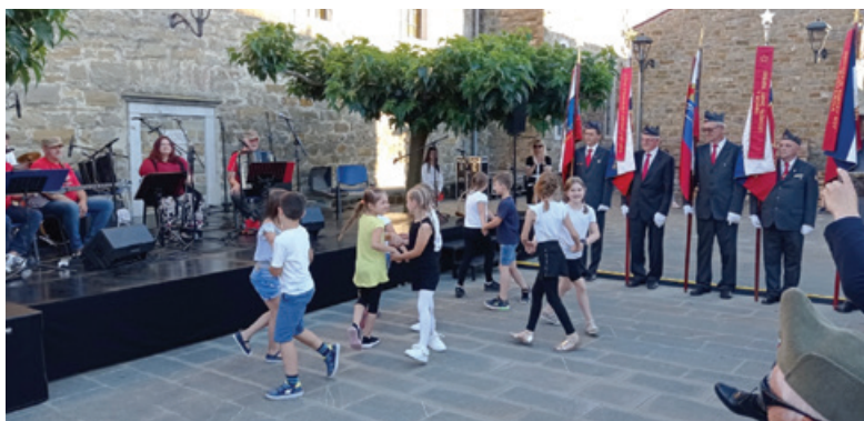
Nastop učencev Osnovne šole Šmarje pri Kopru

V Šmarjah pri Kopru smo počastili spomin na 80. obletnico drugega požiga vasi in presenetljive akcije partizanov Istrskega odreda, ko so ob tem napadli veliko številnejše Nemce, italijanske fašiste in karabinerje ter rešili 40 vaščanov, ki so jih ti imeli že pripravljene, da jih odpeljejo v Rižarno ali druga taborišča.