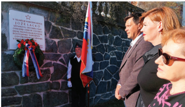
Obnovljena plošča v spomin na ustanovni sestanek Osvobodilne fronte na Potrčevi cesti oktobra 1942

Tudi na Ptujskem so člani Zveze borcev zelo dejavni. Združenje borcev za vrednote NOB Ptuj sestavljajo mestna organizacija Ptuj, občinske organizacije Hajdina, Markovci, Gorišnica in krajevne organizacije: Destričnik, Trnovska vas - Vitomarci, Polenšak - Dornava - Juršinci, Kidričevo, Majšperk. V