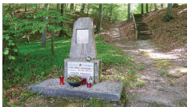
Spomenik Kukovičevim v Spodnjem Dupleku

V splošnem so spomeniki tu lepo vzdrževani, tako kot drugod po Sloveniji. Za razliko od drugih koncev Slovenije na pokopališčih redko najdeš družinski nagrobnik, na katerem bi pisalo, da je nekdo padel v partizanih ali umrl v taborišču, je pa več imen padlih mobilizirancev v nemško vojsko; na celotnem slovenskem ozemlju je bilo takih več kot 10.000. V Trnovski vasi so zapi-