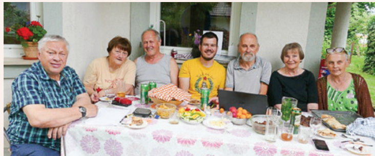
Spomeničarski piknik na Srednji Dobravi 21. junija 2024