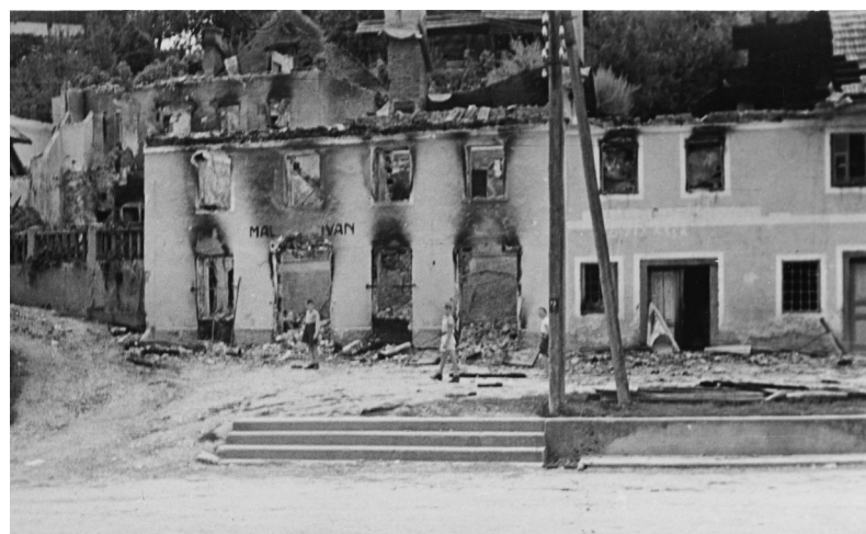
Požgani Malešičeva in Ogulinova hiša v Metliki 16. julija 1944. Danes na tem kraju stoji hotel Bela krajina.

Moritev, rop, požig in skrunjenje nasipal tujec