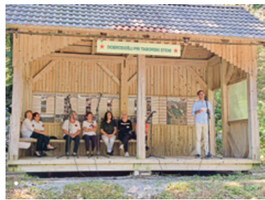
Prireditve pri Taborski steni