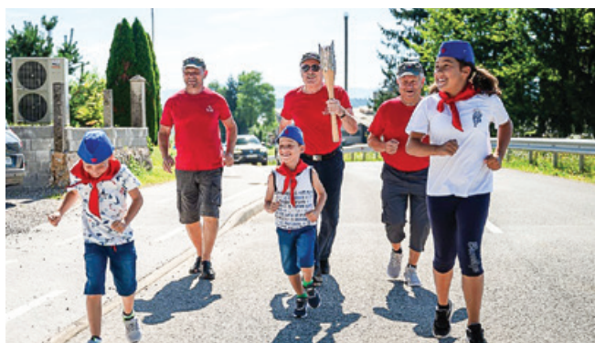
Priložnost za nošenje bakle je dobila tudi borčevska organizacija.

V občini Straža je 5. julija 2024 gostovala Slovenska bakla. Naj spomnim, za kaj pravzaprav gre. Projekt Slovenska bakla je pred tremi leti pred olimpijskimi igrami v Tokiu prvič res temeljito prepotoval vslo Slovenijo. Plamenica, ki so jo leta 2021 ponesti po 211 občinah Slovenije, je zažarela aprila 2021 v jeklarni SIJ Metala Ravne na Koroškem.