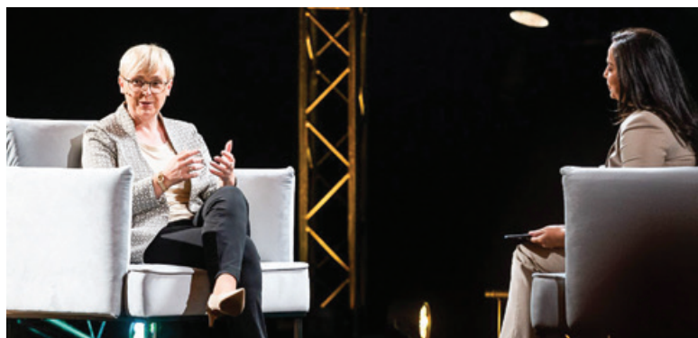
Predsednica Slovenije Nataša Pirc Musar na konferenci v Sarajevu

Predsednica Pirc Musar je v svojem nastopu poudarila pomen Srebrenice v okviru mednarodne zaveze »nikoli več«. Spraševala se je, kako globoko je ponotrjena ta zaveza – če sploh. Ob tem je poudarila, da ima mednarodna skup-