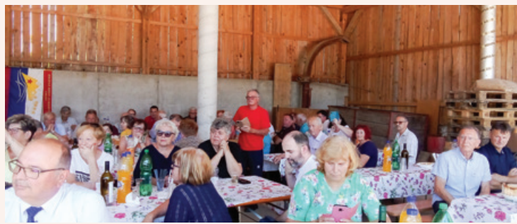
Spominsko srečanje pri Cafu je bilo množično obiskano.

Pri kmetu Smrdelju v Zg. Voličini v Slovenskih goricah je bila leta 1944 ustanovljena zasilna partizanska bolnišnica Cafu. Delovala je v skrivnem bunkerju pod listnjakom v gospodarskem poslojju. Že leta 1953 so na gospodarskem poslojju zdajšnje ugledne domačije Kocbekovih namestili spominsko ploščo. Člani Območnega združenja za vrednote NOB Lenart skupaj s Kocbekovimi lepo skrbijo za njeno vzdrževanje. Bolnica Cafu v Voličini, kjer se je leta 1944 narodnoosvobodilno gibanje zelo razmahnilo, ostaja velik spomenik humanosti v težkih časih nemške okupacije 1941–1945 in narodnoosvobodilnega gibanja, v katero so se na območju Voličine vključevali številni domačini. Mnogi so uporništvu plačali z življenjem.