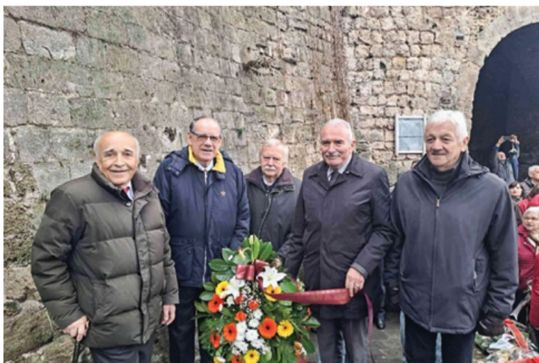
Polaganje skupnega venca borčevskih organizacij

Predstavniki vseh prisotnih borčevskih organizacij iz držav nekda-