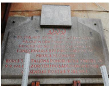
Plošča na pročelju nekdanje orožniške postaje v Selnici ob Dravi