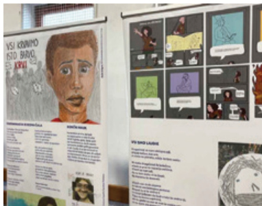
Utrinek z razstave Kdo je drugi?

Spominska slovesnost ob 80. obletnici začetka delovanja partizanske bolnice Jesen je bila 19. oktobra v Velikem Tinju, naselju na slikovitem hribovitem območju Slovenjebistriškega Pohorja. Partizanska bolnica Jesen je bila zgrajena jeseni 1944, dokumenti omenjajo, da je prve ranjene borce Šerčerjeve brigade sprejela 6. januarja 1945 in da se je v njej zdravilo 25 ranjencev, po izjavah zdravniške ekipe pa precej več. Po letu 1961 so barake bolnice Jesen v celoti obnovili, konec 20. stoletja pa je bila partizanska bolnica Jesen preurejena v muzejski kompleks, za katerega skrbi Zavod za kulturo Slovenska Bistrica.