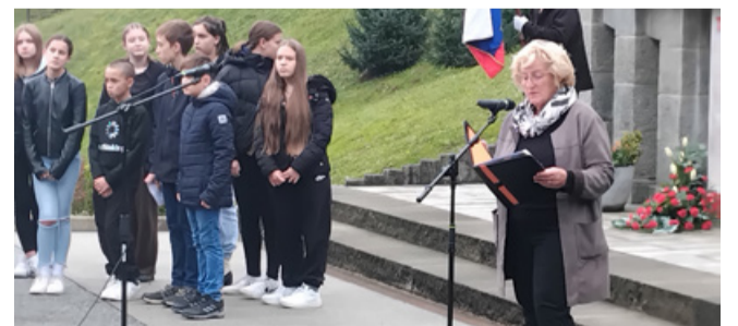
Komemoracija pred obeležjem na Framu