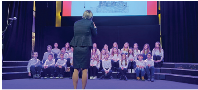
Pevci s Cankarja iz Trbovelj

Letos smo vendarle dočakali, da je bilo petje partizanskih pesmi vpisano v register nacionalne nesnovne kulturne dediščine. In prav ohranitev te dediščine je že vrsto let tudi namen prireditve Praznik partizanske pesmi. Tudi letošnja, že 16. po vrsti, ki je 23. novembra potekala v nabito polni Festivalni dvorani v Ljubljani, je ta namen nedvomno upravičila. Tako so obiskovalci lahko slišali 26 različnih pesmi, med njimi tudi tiste, ki jih sicer na raznih proslavah ne izvajajo prav pogosto in jih je že zaradi tega treba obvarovati pred pozabo.