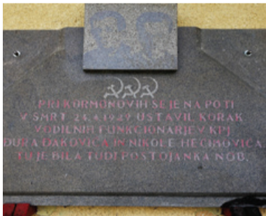
Pri Kormonovih se je na poti v smrt 24. 4. 1929 ustavil korak vodilnih funkcionarjev KPJ, Đura Đakovića in Nikole Hećimovića. Tu je bila tudi postojanka NOB.