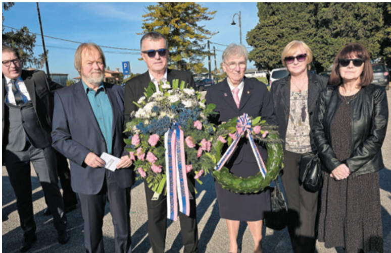
Venca k spominskima obeležjema sta položili delegaciji Občine Vrhnika in ZB NOB Slovenije