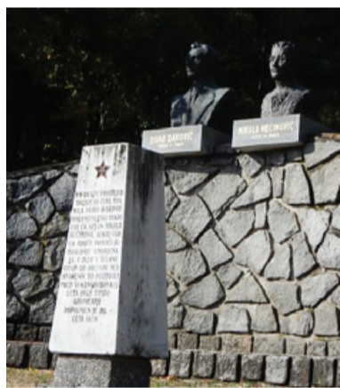
Spominski park pri Sv. Duhu na Ostrem Vrh