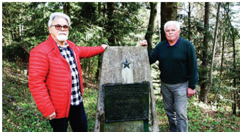
Spomenik Đakoviću in Hećimoviću v Šelovi grapi je v slabem stanju.