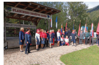
Spominska slovesnost ob 80. obletnici požiga vasice Gozd

Razstava, ki jo je pripravil Tržiški muzej, je prikazovala tragične dogodke 7. oktobra 1944 v Gozdu in je poleg spomina nanje ponudila tudi širši kontekst narodnoosvobodilnega boja na slovenskih tleh med letoma 1941 in 1945 ter poudarjala pomen ohranjanja zgodovinskega spomina na drugo svetovno vojno.