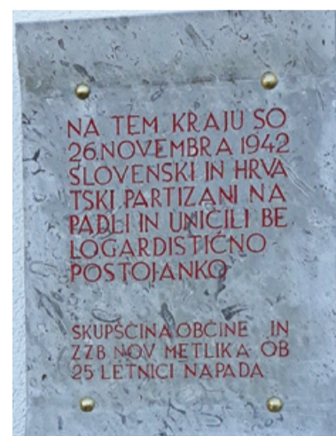
Plošča v spomin na napad na belogardistično postojanko na gasilskem domu v Dolnjem Suhorju pri Metliki

so bile velike količine orožja, streliva in vojaške opreme. Načrt Italijanov, da bi z belogardisti vojaško obvladali Gorjance, je propadel. V spomin na to veliko zmago hrvaških in slovenskih partizanov, ki je zaustavila širjenje belogardizma v Beli krajini, je občina Metlika 26. november razglasila za občinski praznik, obenem pa je to tudi praznik krajevne skupnosti Suhor. Plošče v spomin na partizansko zmago so odkrili na kulturnem domu XIV. divizije 26. novembra 1967. ( Vodič po spominskih obehlezhjih na območju KO ZB NOB Suhor pri Metliki, 2020 )