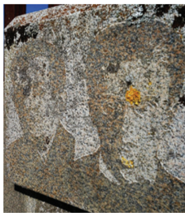
Slabo ohranjena plošča na Šelovi domačiji, Veliki Boč 35