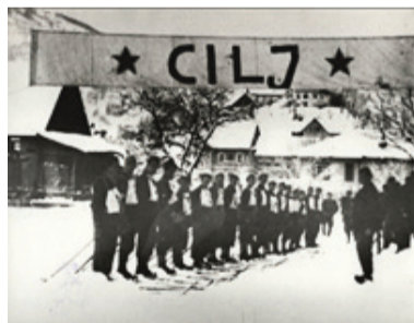
Patrulje postrojene na cilju leta 1945

Prijave sprejemajo do 19. januarja 2025 na priloženem obrazcu. V prijavi navedite priimek in ime, letnico rojstva, točen naslov prijavljenega tekmovalke/ca in kategorijo tekmovanja (tek ali veleslalom). Glede na število prijavljenih bo do 23. januarja 2025 izdelana in podana točna časovnica.