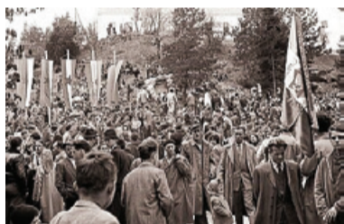
Proslava v čast 40. obletnice KPJ v Duhu na Ostrem Vrh 1959