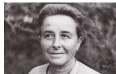
Pisateljica in nosilka partizanske spomenice 1941

skemu preiskovanju, zasliševanju in nasilju. Podoba otrok, ki odraščajo v vojni, ni idealizirana: so nagajivi in neubogljivi, seveda prestrašeni, prizadeti in žalostni, pa tudi iznajdljivi, odgovorni in prezgodaj odrasli, saj se morajo vesti preudarno in zrelo. Izrazito opazno je, da je pomoč partizanom in Osvobodilni fronti za navedene otroške like samoumevna, kar je spričo njihove mladosti presenetljivo, vendar v funkciji oblikovanja pozitivne naravnosti do narodnoosvobodilnega boja; pri tem ne gre za ideološko prikazovanje herojskih otroških potez, temveč za otroke, ki skušajo preživeti v nasilnem času in prostoru tudi tako, da se skušajo vesti kot odrasli. V drugo skupino spadajo povojni otroci, ki poslušajo pripovedovanje o narodnoosvobodilnem boju: to je vnuk nekdanje aktivistke, sin nekdanjega ranjenega partizana, deček, ki je sam doma, ker so starši v službi. Ti otroci vojno poznajo zgolj iz pripovedovanja, doživljajo jo kot pravljico, vsi po vrsti uživajo v pripovedovanju o njej. Obravnavani