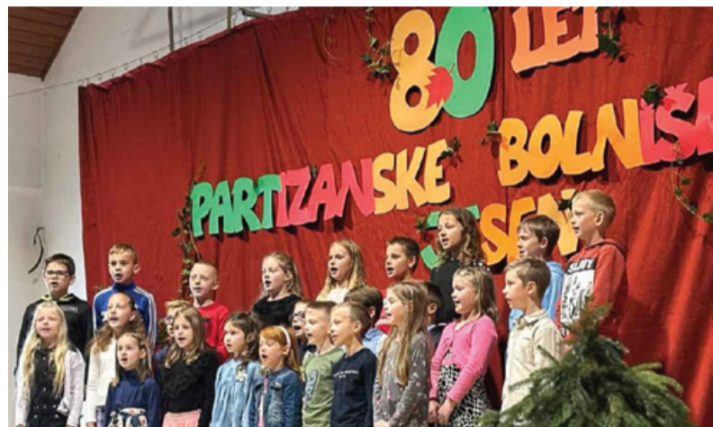
Pevski zbor Osnovne šole Partizanska bolnišnica Jesen Tinje

Drago Mahorko, foto: arhiv ZZB NOB Slovenska Bistrica